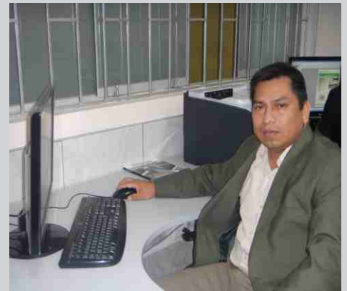
JEFE DE VALUACIÓN