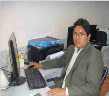
JEFE DE TOPOGRAFÍA