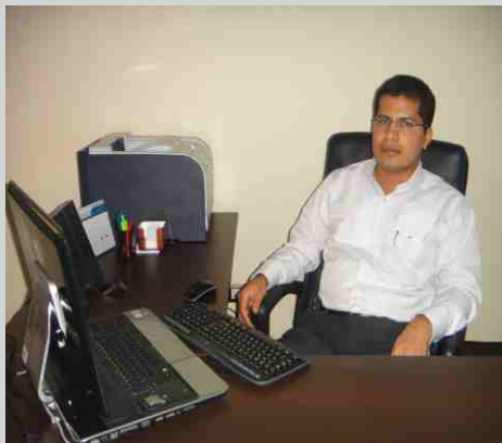
GERENTE DE PROYECTOS